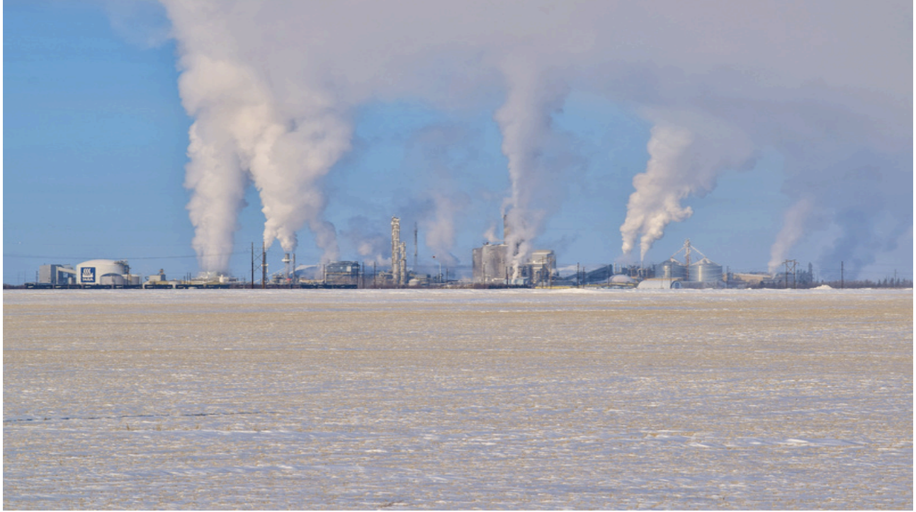
कनाडा में यारा (Yara) बेले प्लेन उर्वरक फ़ैक्टरी